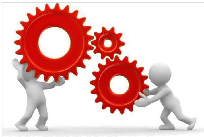
Imagem 1: A metodologia do trabalho científico